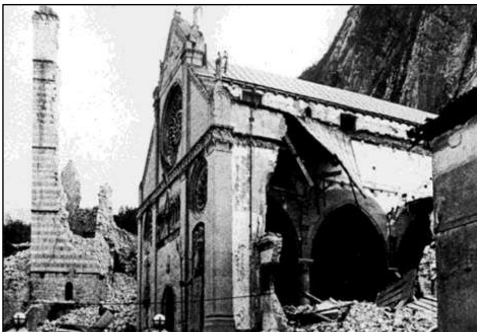
Il Duomo di Gemona dopo le forti scosse della sequenza avvenuta in Friuli