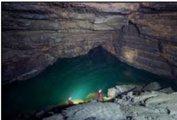
La caverna, lato sifone di entrata.