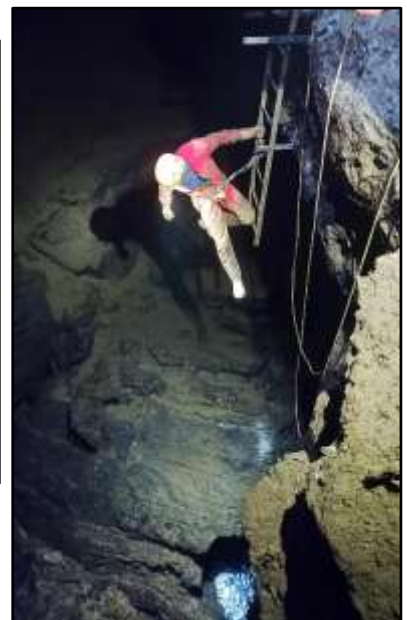
Si vede l'acqua

quando il lavoro li lasciava andare, per cui in giorni diversi e strani orari mattina, sera oppur anche di notte l'irrefrenabil passion per le grotte li spinse a ritrovarsi in tempi vari.