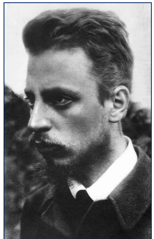
Rainer Maria Rilke