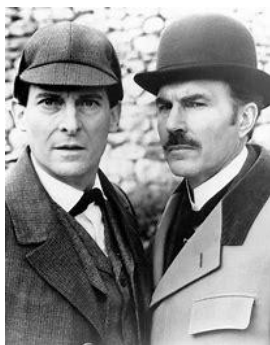
Jeremy Brett e David Burke nella serie televisiva Granada TV (1984)

E così ancora oggi, a quasi centoquarant'anni dal suo primo apparire, Sherlock Holmes è sempre vivo e vegeto, pronto ad indossare mantellina e berretto mentre togliendosi la pipa di bocca invita il dottor Watson a seguirlo in una nuova avventura: "Andiamo, Watson, il gioco ricomincia!"