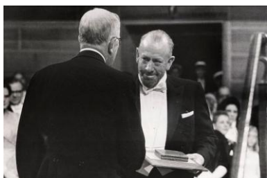
John Steinbeck riceve il premio Nobel (1962)

Dopo una vita dedicata alla letteratura ed al giornalismo (fu infatti anche corrispondente di guerra ed articolista impegnato), muore il 20 dicembre 1968 e viene sepolto al Garden of Memories Cemetery di Salinas. Nel 1976 esce postumo Le gesta di re Artù e dei suoi nobili cavalieri , rifacimento dell'opera di Thomas Malory del 1485.