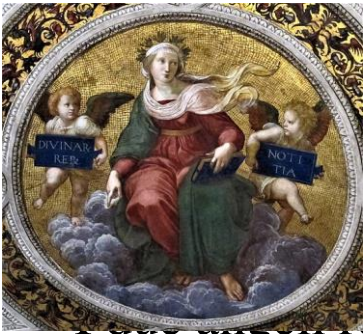
Raffaello , Allegoria della Teologia , Stanza della Segnatura, Roma leggono la scritta “ Divinarum rerum notitia ”