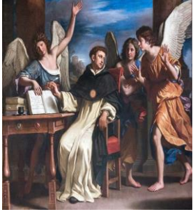
Velazquez, San Tommaso d'Aquino

Per Tommaso esiste per tutte le creature un diritto naturale [tesi sostenuta già dagli Stoici e secoli dopo dal cosiddetto giusnaturalismo ], cioè una legge di natura che può essere presa a fondamento anche del diritto canonico e riassunta in tre inclinazioni → 1) verso il bene naturale [ principio di conservazione ]; 2) verso determinati atti , specifici per ogni essere vivente; 3) verso il bene secondo la ragione [propria solo dell'uomo], che comprende anche l'inclinazione a ricercare e conoscere la verità e a vivere in società [v. Aristotele “uomo” = “ animale politico ”].