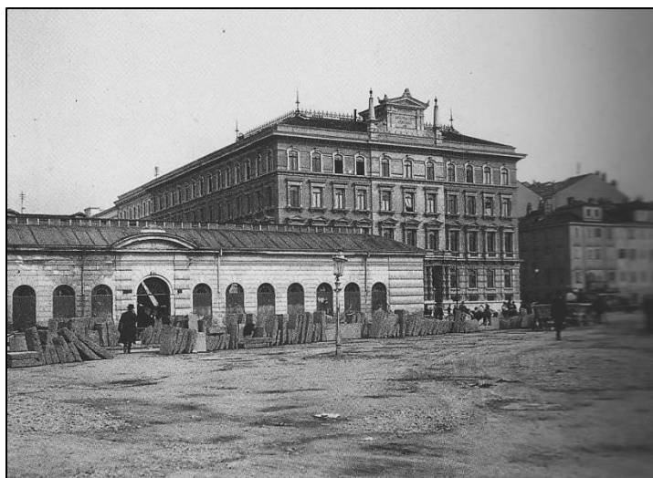
Dietro, il palazzo delle Assicurazioni Generali