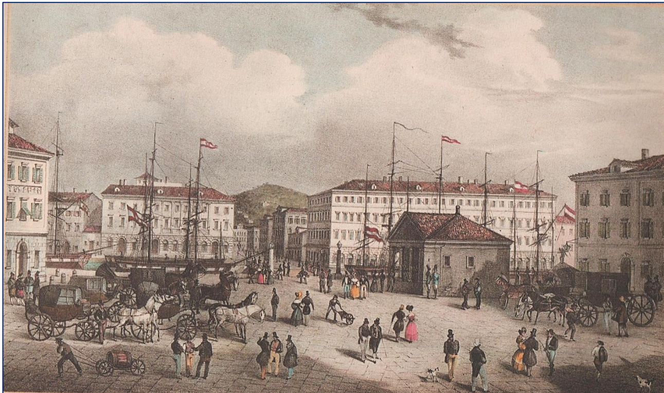
Piazza del Ponte Rosso a Trieste Tomaso Viola 1830