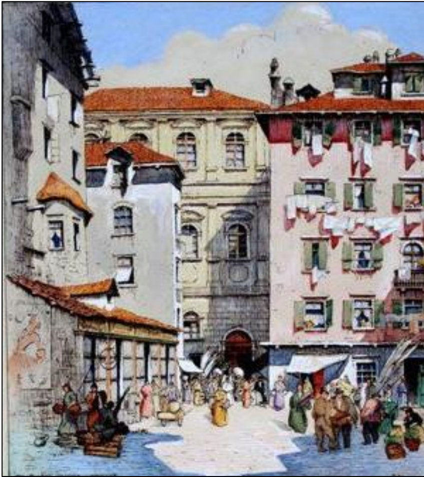
Piazza Vecchia Santo Lucas