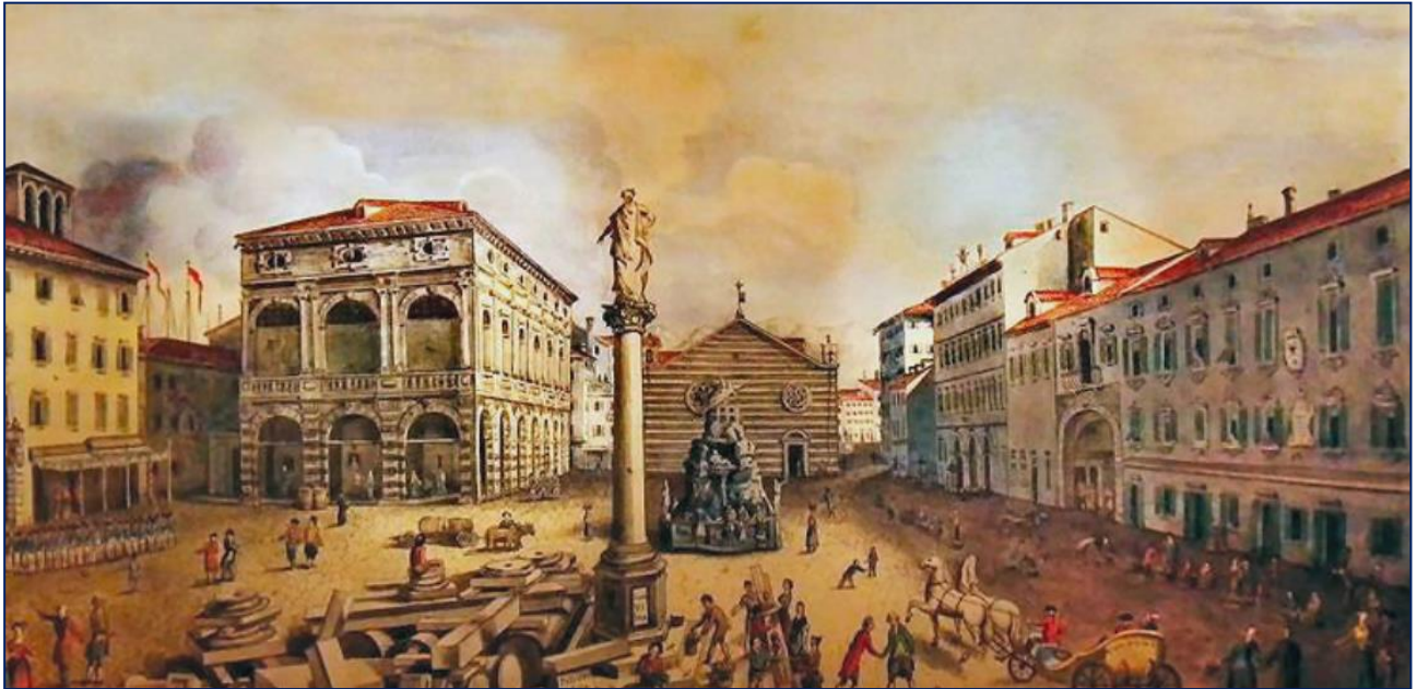
Veduta della Piazza Grande in Trieste Pietro Nobile 1796

Pietro Nobile (1776–1854) è stato un architetto ticinese.