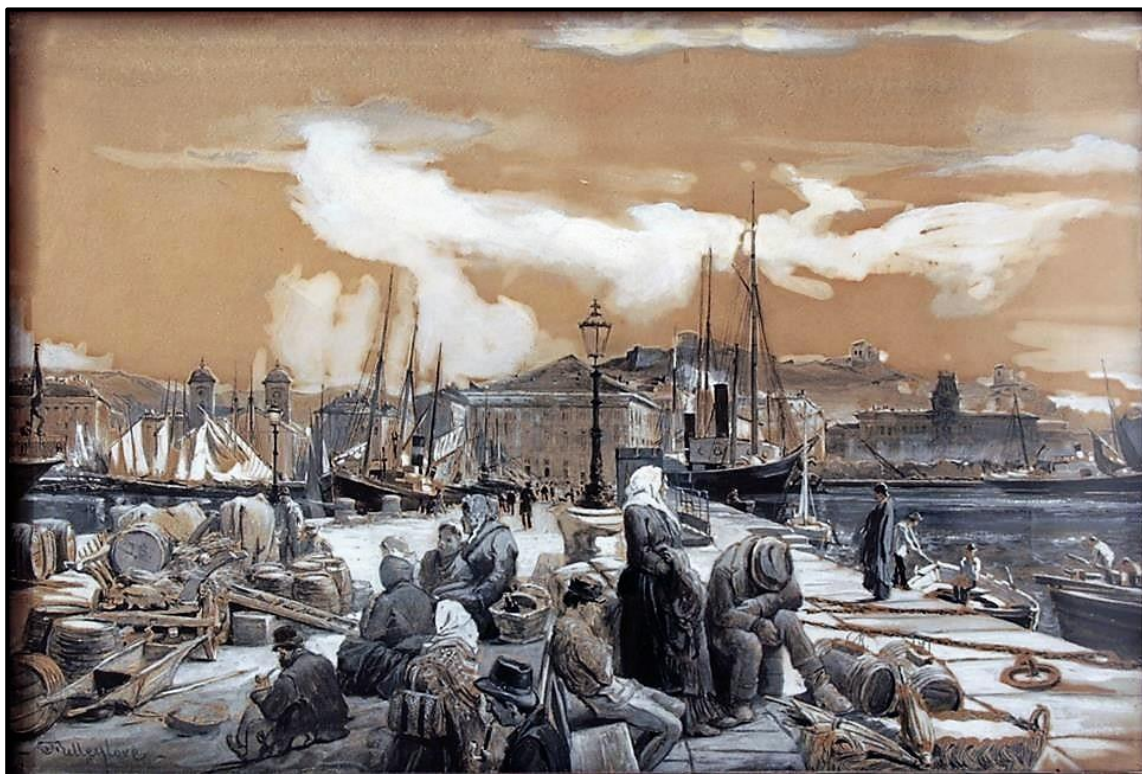
John Fulleylove Molo San Carlo a Trieste

John Fulleylove(1845 – 1908) è stato un pittore inglese, acquarellista e illustratore di paesaggi.