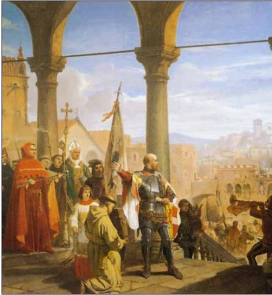
La dedizione di Trieste all'Austria Cesare Dell'Acqua (1856)