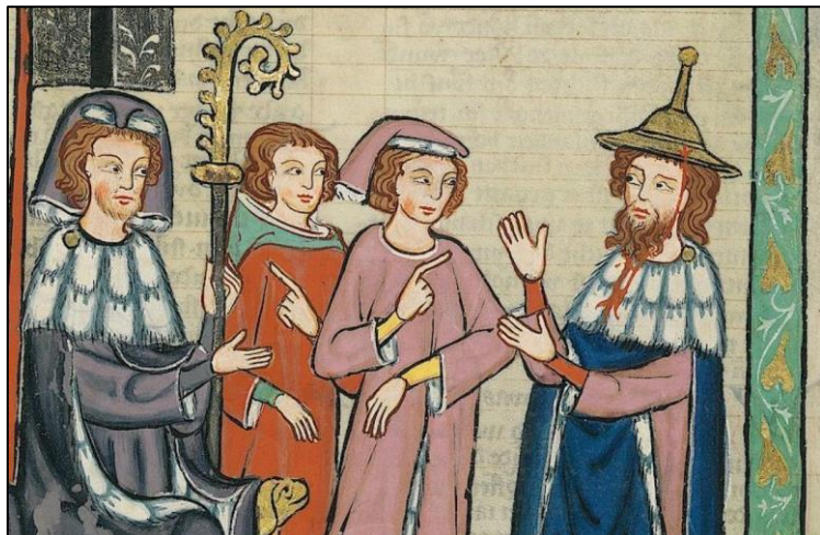
Illustrazione dal Codex Manesse del poeta ebraico Süßkind von Trimberg, con il caratteristico copricapo giallo (XIV secolo)