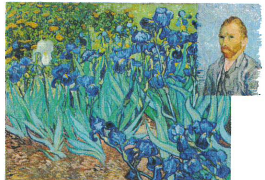
Vincent van Gogh, “Les iris”, 1889