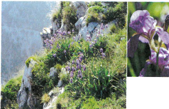
( Iris cengialti subsp. illyrica )